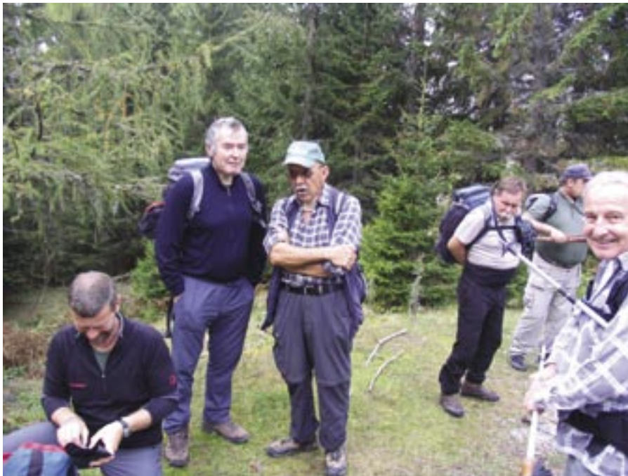
Na gorskem pohodu v Karavankah.

ročili stroke in izraženim interesom članov. Načrtovani znesek programa znaša 20.642,36 eur.