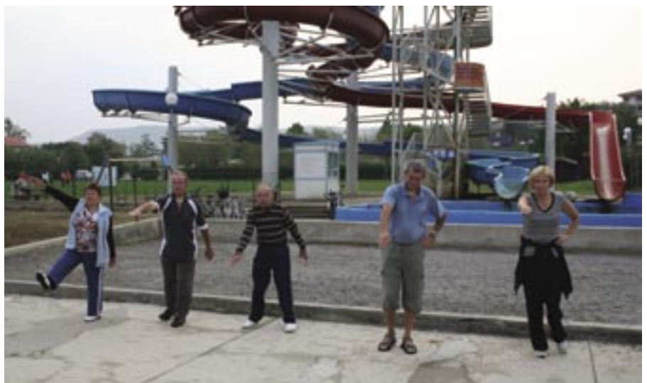
Jutranje razgibavanje na govornem tečaju.

Delovanje mreže prostovoljcev poskuša omiliti prostorsko oddaljenost posameznih