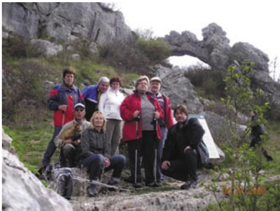
Člani z Obale v hribih.