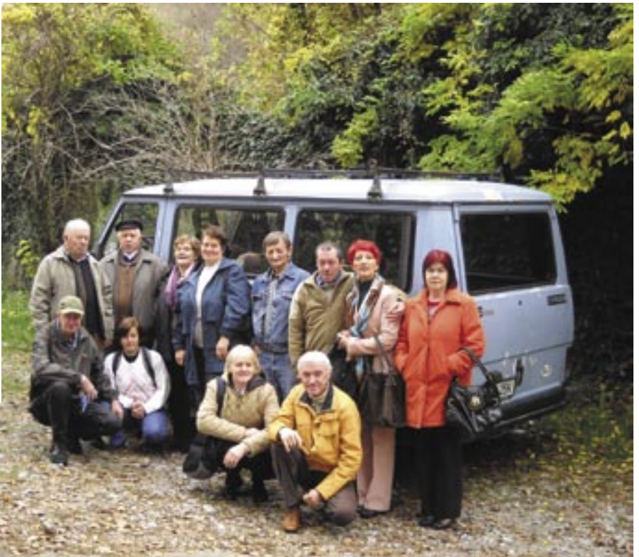
Zbrani člani PK Severne Primorske.