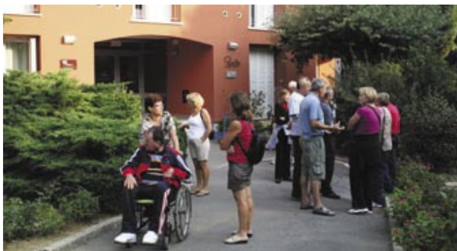
Na govornem tečaju v Simonovem zalivu.

Te okoliščine nam narekujejo, da tudi v našem društvu načrtujemo previdno v okvi-