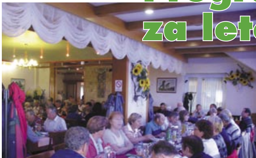
Lansko letno srečanje članov DLS na Dolenjskem.