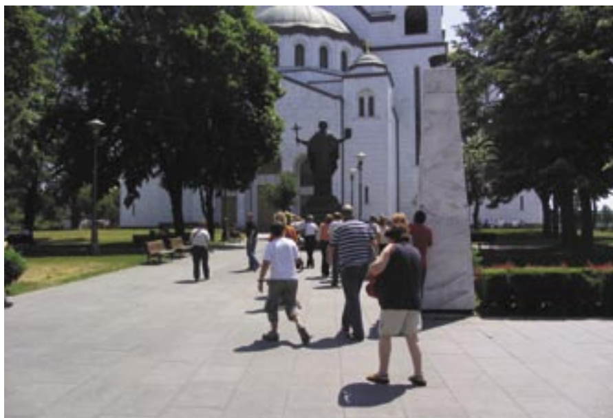
Lansko leto je PK Ljubljana organiziral izlet v Beograd.