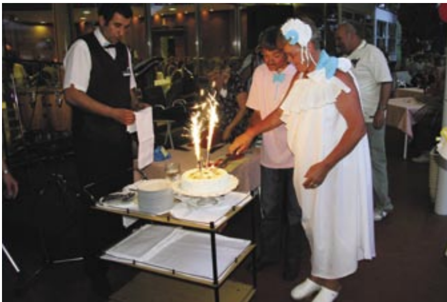
»Poročna torta« v Vodicach.

Socialno stisko laringektomiranih z najnižjimi dohodki, poskuša društvo omiliti z uveljavljanjem posebej znižanih kotizacij pri udeležbi v vseh pomembnejših programih. Program zajema svetovanje in varstvo socialnih pravic članov. Sredstva enkratne pomoči kot intervencijska sredstva, lahko dobi laringektomirani v primeru