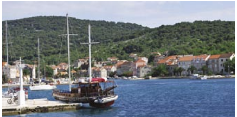
Psihosocialna rehabilitacija v Dalmaciji.

Je najstarejši program DLS, saj ga društvo izvaja že skoraj od svoje ustanovitve leta 1982. Še posebej močno se je razvil v zadnji desetih letih, upošteva pri tem zlasti pozitivne izkušnje društev Nemške zveze laringektomiranih. Sedaj program učenja nadomestnega govora poteka že skoraj po utečenih standardih. Za številne bolnike v post operativnem obdobju pomeni prve korake k »ponovni vrnitvi v življenje«. Ankete in odzivi članov v društvenem glasilu kažejo izredno pozitiven odziv udeležencev teh tečajev, kljub velikemu naporu, ki ga ta program terja od laringektomiranih. Enako pozitivno se na ta program odzivajo tudi svojci laringektomiranih. Tečaj