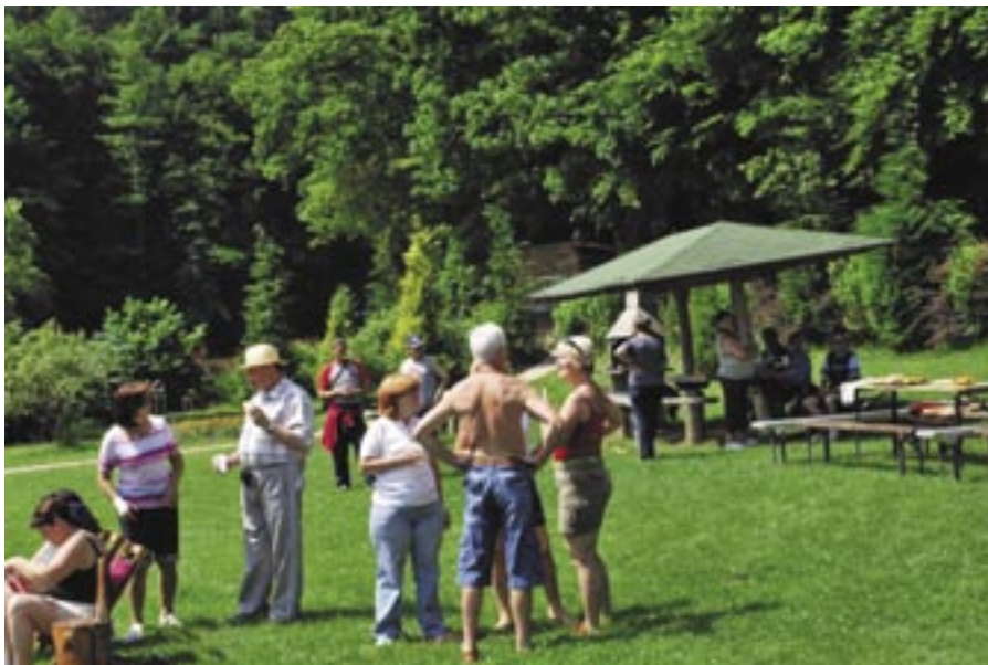
Korošci in Štajerci se vsako leto zberejo na Farovcu.

Za PK Štajerska in Koroška, Danilo Papež