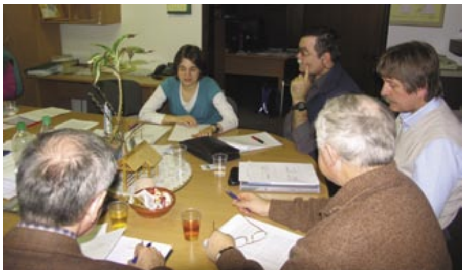
Na izobraževanju.