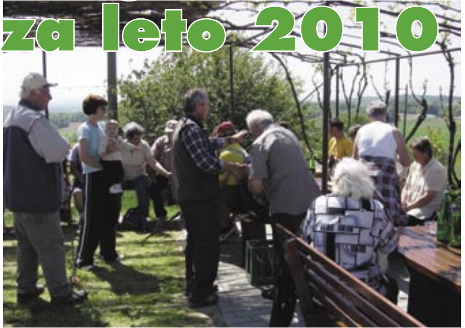
Prekmurski pohodniki.