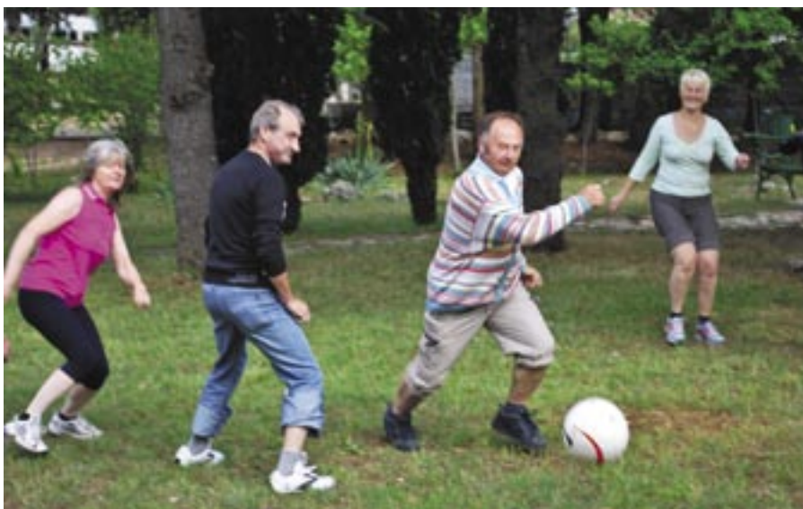
Zagnani nogometaši.