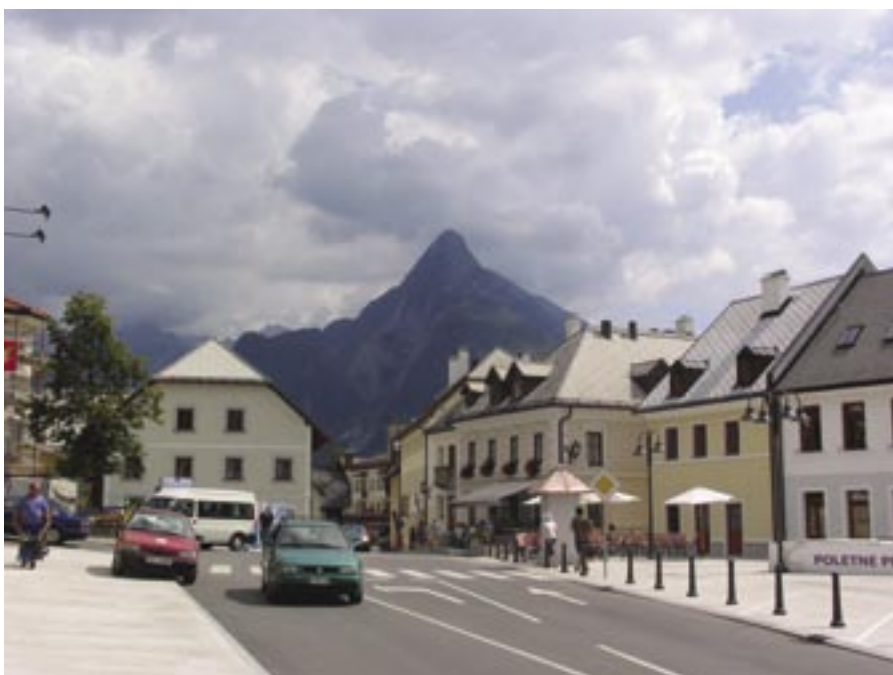
Program ohranjanja zdravja bo tudi letos potekal v Bovcu.

Ta program bomo poskusili obogatiti z dodatnimi aktivnostmi skladno s pripo-